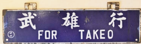
▲行先表示板(サボ)「武雄行」 / 個人蔵

昭和28(1953)年に運行を開始した京都～博多間を結ぶ特急「かもめ」のヘッドマークとは、列車の愛称を文字やイラストで示したもので、列車の先頭部に取り付けられる。