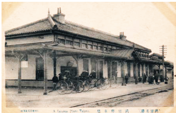
◀旧武雄駅舎(絵葉書) 明治～大正時代頃 / 武雄市蔵

明治28(1895)年に開業した武雄駅(現在の武雄温泉駅)の姿を写す絵葉書。駅前には人力車が待機していて、その前を線路が延びる。これは、武雄から塩田を経て鹿島の祐徳稲荷神社の門前まで続いた祐徳軌道。高橋(現武雄市朝日町)から甘久、武雄を通り、祐徳門までの約24kmを結んだ。(昭和6年廃止)