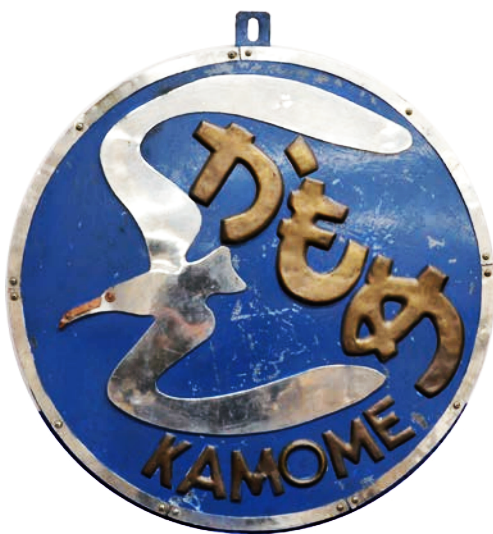
▲特急「かもめ」ヘッドマーク / 京都鉄道博物館蔵

明治28(1895)年に開業した武雄駅(現在の武雄温泉駅)の姿を写す絵葉書。駅前には人力車が待機していて、その前を線路が延びる。これは、武雄から塩田を経て鹿島の祐徳稲荷神社の門前まで続いた祐徳軌道。高橋(現武雄市朝日町)から甘久、武雄を通り、祐徳門までの約24kmを結んだ。(昭和6年廃止)