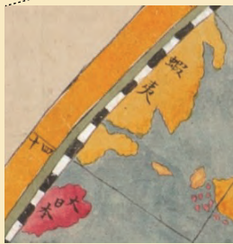
「蝦夷」・「大日本」部分拡大

地球を西半球(図左)と東半球(図右)にわけて描いた世界地図です。17世紀前半頃の世界地図を写したものではないかと考えられていますが、詳しいことはわかっていません。東半球図は日本列島などがある部分が破れていますが、当時、蝦夷地と呼ばれていた北海道の一部は図に残っています。また、西半球図の左上部分に「蝦夷」や「大日本」とあり、日本列島の一部を確認することができます。