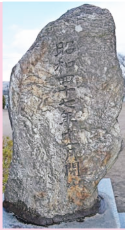
▲「明治鉱業株式会社 西杵炭鉱址」の石碑

西杵炭鉱があったことを伝える貴重な石碑です。裏面には、「昭和四十七年十一月閉山」の文字が刻まれています。西杵公民館近くの公園に建てられています。