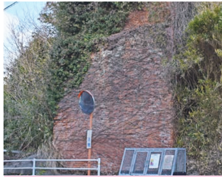
◀ うんばんき どう ボタ運搬軌道の橋げた跡

炭鉱には、製品となる石炭とボタ(岩石や質の悪い石炭)を分ける選炭施設がありました。ボタはトロッコによってボタ山まで運ばれました。写真のレンガ造りの遺構は、トロッコの線路を支える橋げたの跡です。