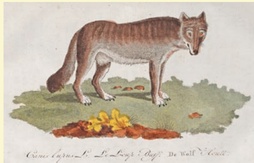
▲『簡約日用百科事典』よりオオカミのさし絵

オランダ語で書かれた百科事典です。植物学、動物学、医学、薬学など自然科学の項目について幅広く書かれています。