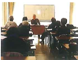
古典講座 (昭和50年代前半～)