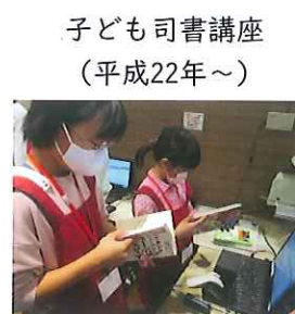
子ども司書講座 (平成22年～)