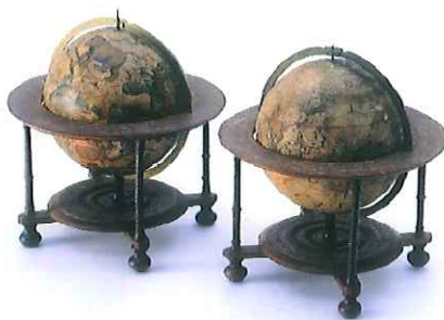
▲天球儀・地球儀 ◀「長崎方控 二」より いずれも国重要文化財 武雄鍋島家資料 武雄市蔵

「長崎方控 二」の天保15年2月10日に「蘭製天地球 二ツ」という記録があります。また、武雄市が所蔵する天球儀・地球儀の箱には、「天保十五年辰春」と書かれており、「長崎方控」の記録と一致しています。