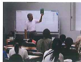
夏休み子ども講座 (平成13年～)