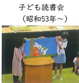
子ども読書会 (昭和53年～)