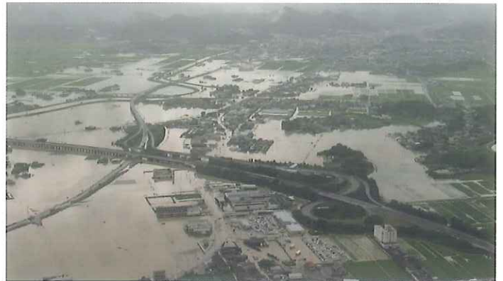
▲令和元年8月豪雨被害の様子

令和元年8月、記録的な豪雨により武雄市は甚大な被害を受けました。武雄には六角川や松浦川が流れており、古くからその恵みを受けてきましたが、豪雨時の災害や干ばつによる作物の影響など、苦勞を強いられてきたことが記録に残されています。人々は治水を行い、水とともに生きる道を模索し続けてきました。