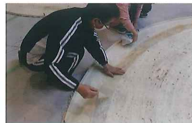
↑ 傷んだ和紙の部分に裏打ちしている様子。