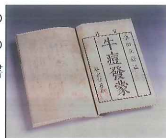
【図1】▲牛痘發蒙 国重要文化財 桑田立齋著 武雄鍋島家資料 武雄市蔵