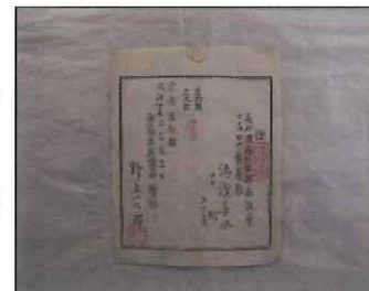
【図2】▲種痘初種証 津山洋学資料館蔵